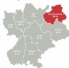
Répartition des entreprises de la filière dans les départements de Rhône-Alpes