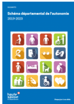
Schéma de l'autonomie 2019-2023