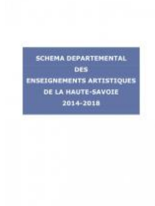
Schéma des enseignements artistiques