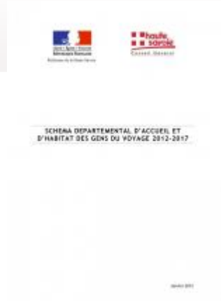
Schéma d'accueil des gens du voyage 2012-2017