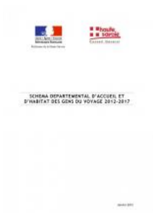
Schéma d'accueil des gens du voyage 2012-2017