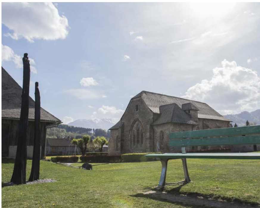
La chartreuse de Mélan et son parc de sculptures.

Des opérations d'entretien et de restauration sont régulièrement menées sur les sites culturels patrimoniaux du Département : la chartreuse de Mélan, le château de Clermont, les sites des Glières (Morette et plateau des Glières), le Conservatoire d'Art et d'Histoire, l'abbaye d'Aulps et l'abbaye de Sixt.