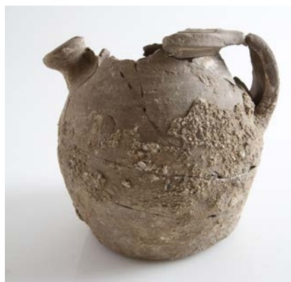
Cruche en céramique du XII e siècle, découverte au Château-Vieux d'Allinges en 2011.

Le Département impulse des projets de recherche sur des sujets patrimoniaux pluridisciplinaires en partenariat avec les universités. Il assure également un soutien technique et financier à la recherche archéologique de Haute-Savoie, en lien avec le Service régional de l'Archéologie.