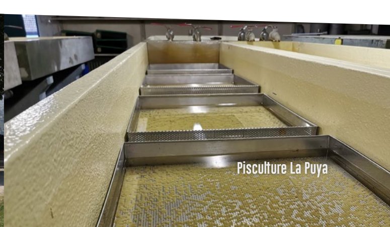
Pisciculture La Puya