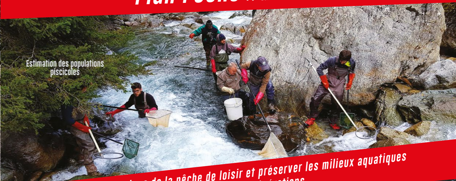
Estimation des populations piscicoles

Renforcer la pratique de la pêche de loisir et préserver les milieux aquatiques Initier les nouvelles générations